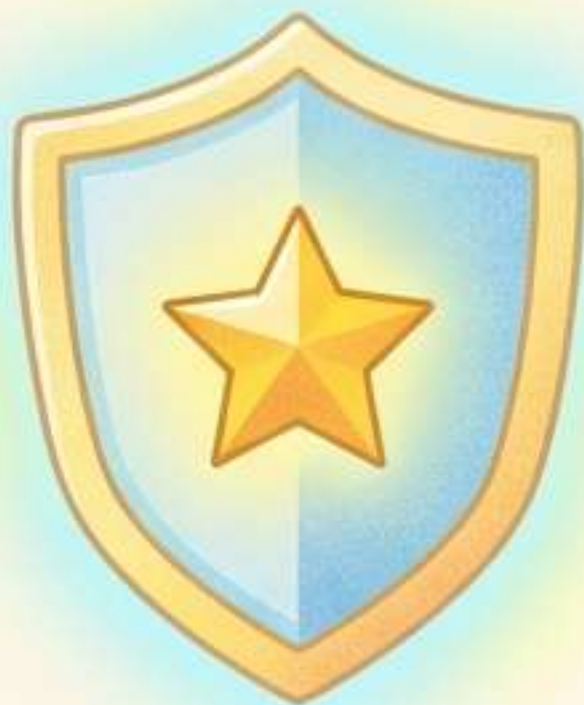
Uno Scudo Magico