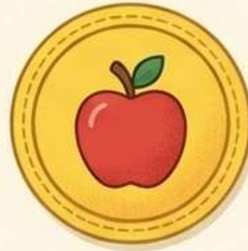
Salute e Cibo