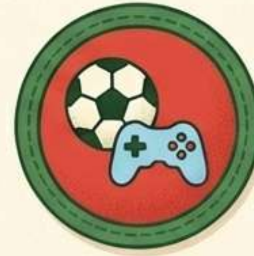
Gioco e Riposo