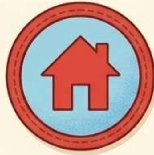
Famiglia e Nome